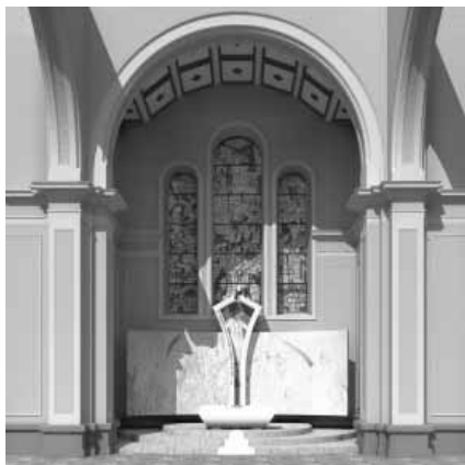
Grozdetova kapela v romarski cerkvi na Zaplazu

Kongregacija je preučila življenjepis, spise in celotno zbrano gradivo na škofijskem postopku ter ugotovila pravilnost in znanstvenost dokazov. Na podlagi tega je izdala dovoljenje, da se Lojzeta Grozdeta povzdigne na čast oltarja. Iz dokazov je nedvoumno razvidno, da je umrl zaradi sovraštva do katoliške vere (in odium fidei).