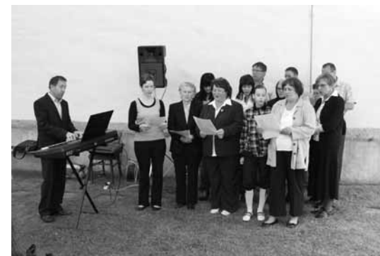
Pevci iz domače župnije