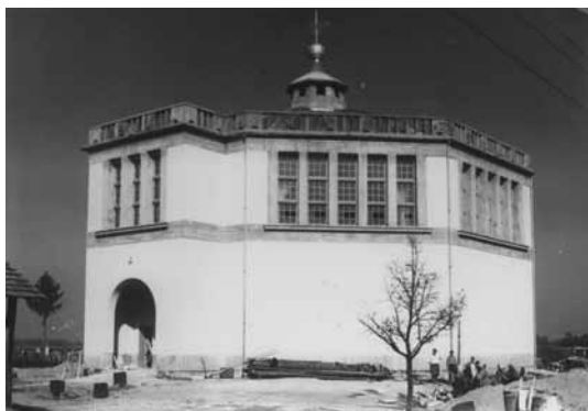
Odranska cerkev Sv. Trojice do leta 2005